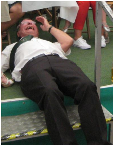
„Erste Hilfe“ kommt gleich ☺