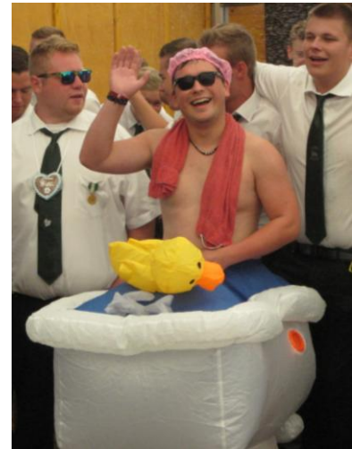
aus den Jungschützen-Reihen

Mit dem Königsvogelschießen am Nachmittag, ging das Schützenfest ins Finale. Mit gespannten Blicken beobachteten die Teilnehmer die Schüsse ihrer Kameraden. Aber auch viele Zuschauergäste versammelten sich mit großem Interesse auf dem Schießplatz.