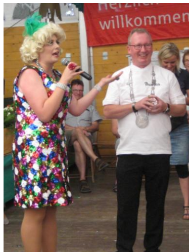
„Blonduella“ mim König