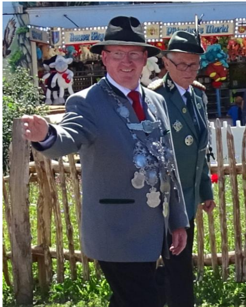
Der König mit Brudermeister