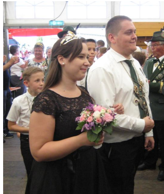
und alle anderen 4 Majestäten